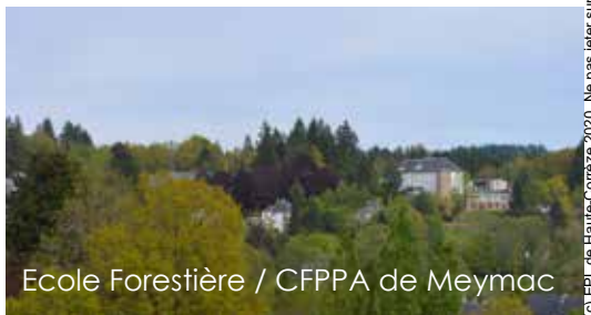
Ecole Forestière / CFPPA de Meymac

• Centre habilité pour formation/évaluation au permis tronçonneuse européen (ECC)